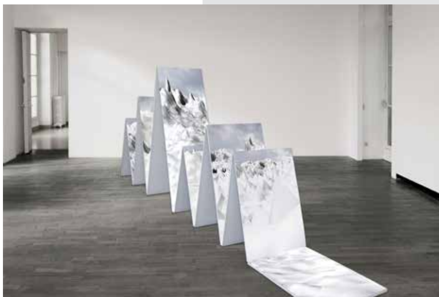
High Land, 2015

et le graphisme dans divers établissements privés de la capitale. Après avoir longtemps développé une recherche plastique centrée sur l'humain, Lionel Bayol-Thémines élabore un univers visuel où coexistent de manière symbiotique deux mondes, ou plutôt deux espaces, l'un réel, l'autre virtuel. Inspiré par le philosophe Vilém Flusser - qui a questionné l'histoire des