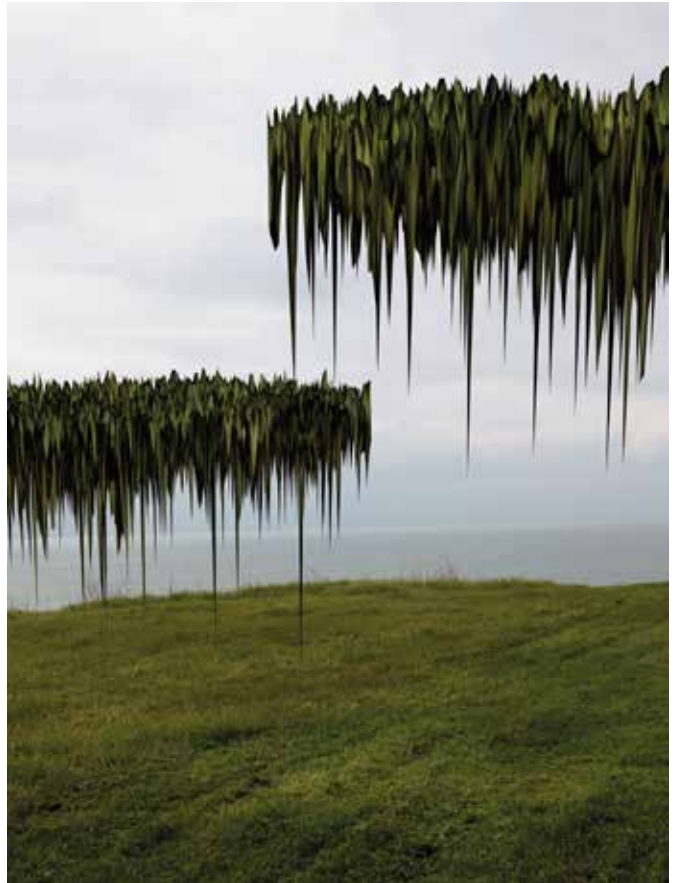
Low Land #5, photographie, 2014