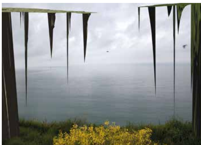
Low Land #13 , photographie, 2014

Ces paysages fictionnels sont créés par la modification du codage numérique de l'image sur la photographie originelle. En jouant sur le code de révélation informatique de la photographie, Lionel Bayol-Thémines souhaite rendre visible les mutations de la nature du fait de l'activité humaine sur l'environnement.